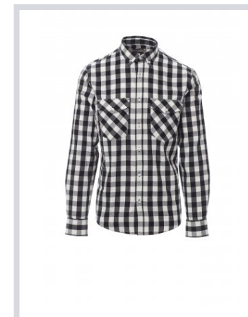
NERO/PANNA A QUADRI