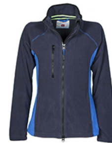
BLU NAVY/BLU ROYAL